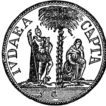
די מסבע וואָס טיטוס האָט געמאַכט אין אַנדענקען פֿון זיין זיען.

טויט. האָט די מוזיק אָנגעהויבען שפּילען, די גלחים האָבען מקריב געווען קרבנות און גאַנץ רוים האָט געשטורמט מיט פרייד-געשרייען. איצט האָבען זיי צוגענומען דעם אונערשראַקענעם העלד